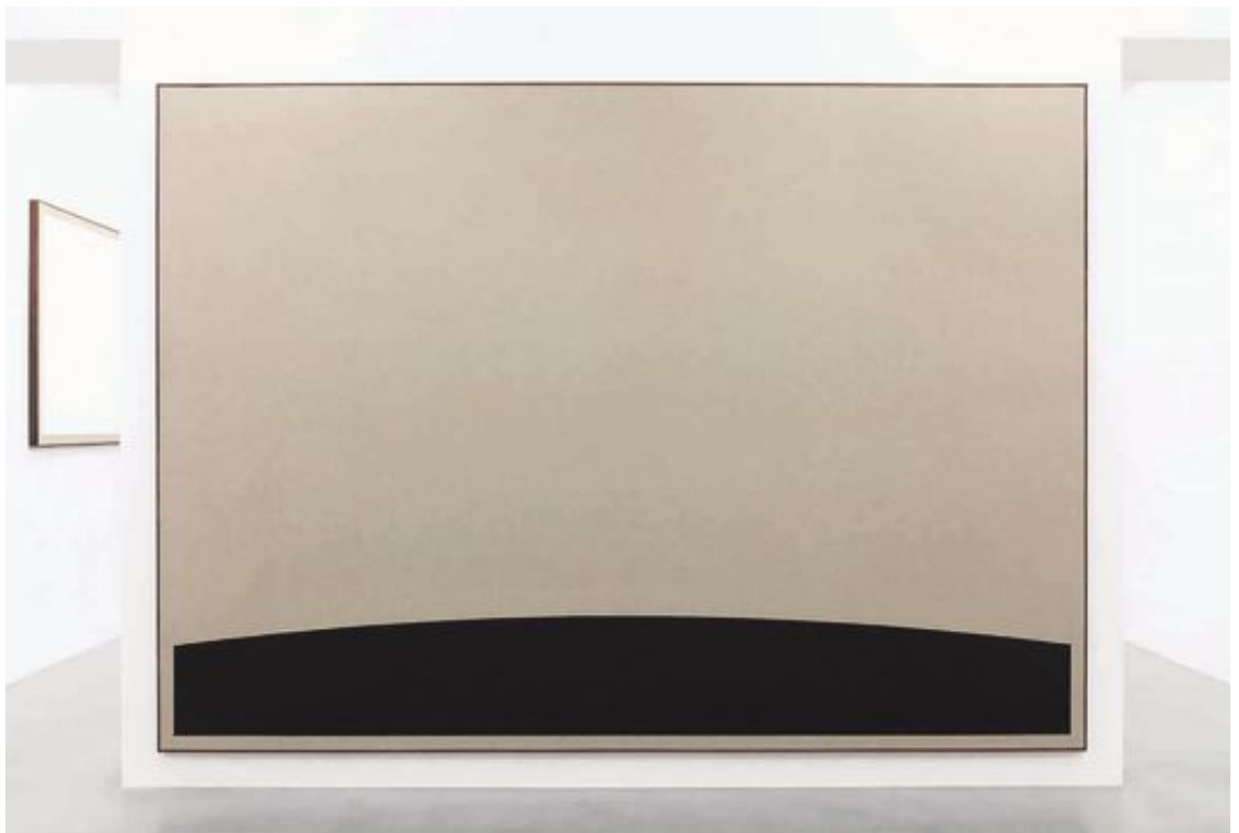
LANDING: «I dette verket kan man på en måte gå inn for landing sier kunstneren Paul Fägerskiöld om «Terra Incognita».

FOTO: PAUL FÄGERSKIÖLD, TERRA INCOGNITA, 2016