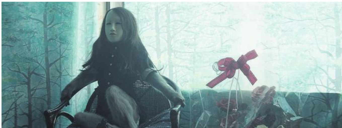
HUMAN MASK: Pierre Huyghe, (Untitled) Human Mask, 2014 (film still).