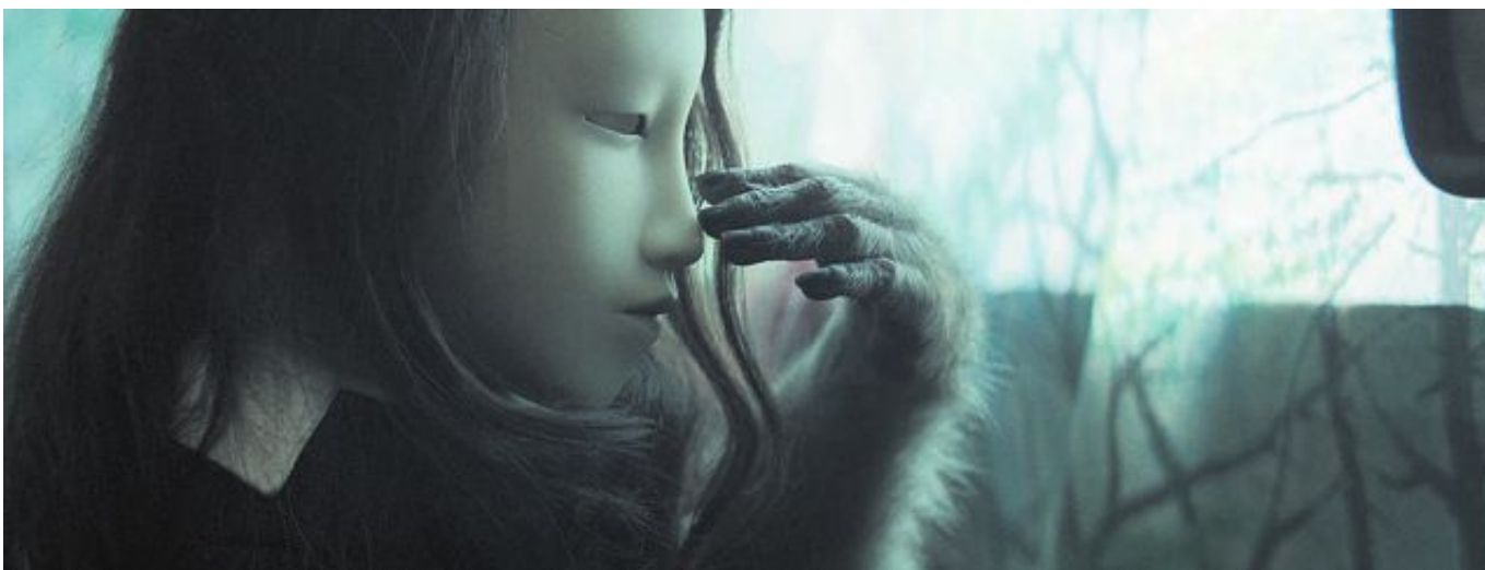
HUMAN MASK: Pierre Huyghe, (Untitled) Human Mask, 2014.