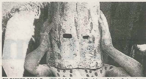
SILPHIUM, 2014. En stillbild från HD-video på Lina Selanders utställning på Konsthallen i Örebro.

Lina Selander infogar sig som en representant för detta nya i konsten. Hjälpad och nästa är vårt lands representant på Veneçigbiennalen, är hon minst sagt het och aktuell med tre utställningar till i Sverige och Norge samtidigt som hon nu visas i Örebro. Det är möjligen ett exempel på hur nya medier och arbets-sätt gör det möjligt att utan allt för stora konstnärliga sömner eller glapp kunna vara på flera platser samtidigt med det man vill säga. Lina Selander är bildkonstruktör med främst filmisk framställning i sina presentationer, men arbetar egentligen med något som liknar vetenskapliga