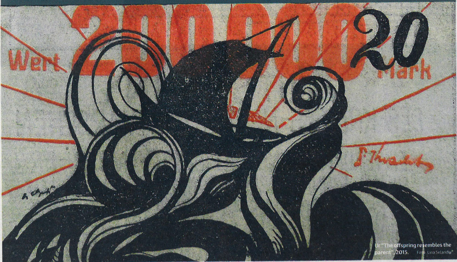
Ur "The offspring resembles the parent", 2015.

Utställning. Filmverk av Lina Selander aktuella i Stockholm